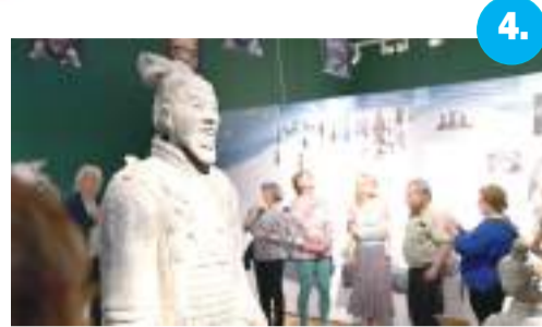
62 ezren látták az ókori Kína-kiállítást