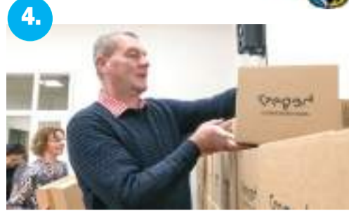
Húsvéti élelmiszercsomaggal segít Szeged