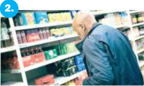
Az élelmiszerek drágultak a legjobban