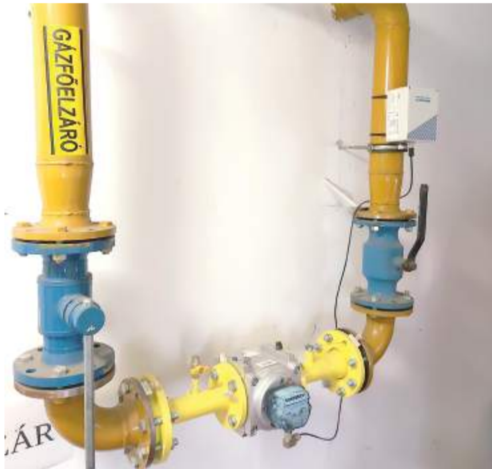
Tavaly év elején zárták a gázfőelzáró csapok, Szeged városa eleget tett a kormány felszólításának. Most mégis büntetni akarja a kormány cége, az MVM az önkormányzatot, mert spóroltak az energiával a város cégei és intézményei.

Százmillió forintos büntetést akar fizettetni a kormány irányítása alatt álló Magyar Villamos Művek az önkormányzattal, mert takarékosak voltak az energiával a város cégei és intézményei.