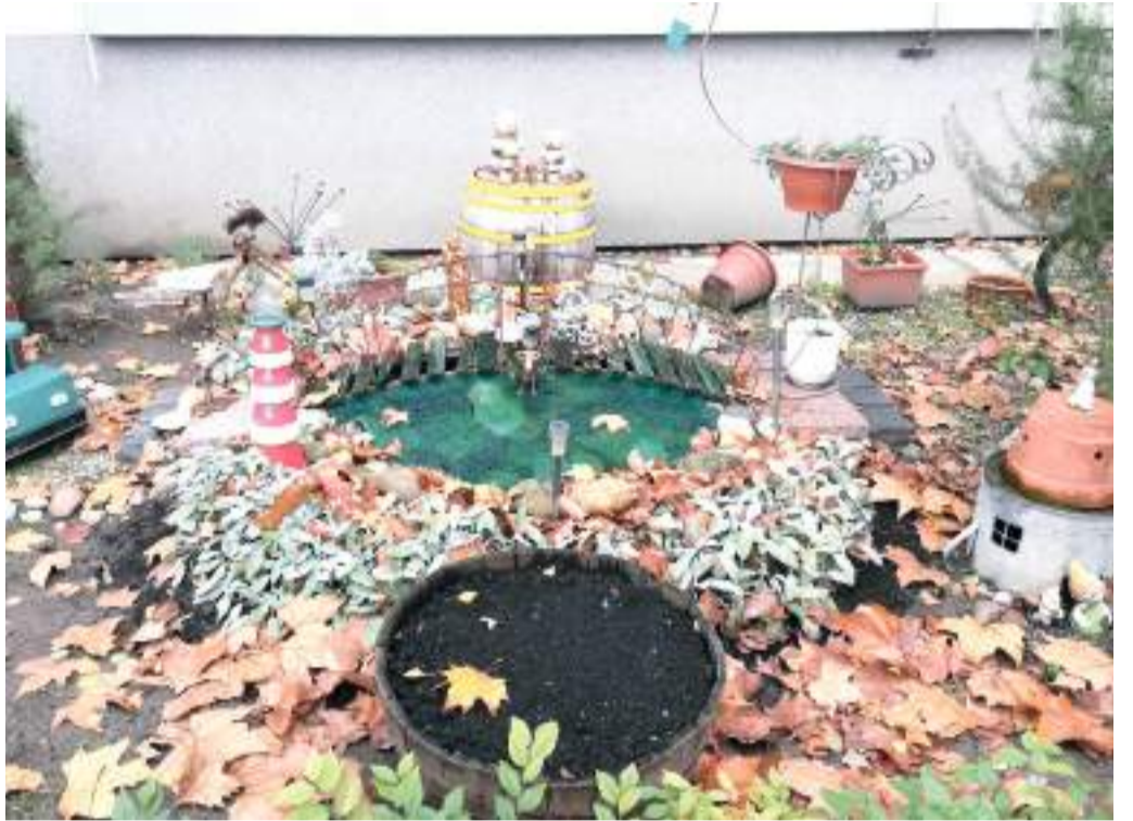
Mackók az Építő utcában. Ez a mackócsalád télvíz idején is jól érzi magát az egyik panelház előkertjében, kedves dekoráció a díszhordó tetején.