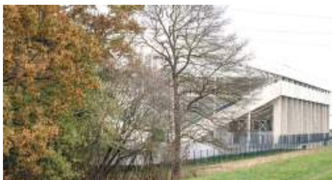
Véderdő a püspöki stadion mellett. A megkérdezett szegediek egyöntetű véleménye: maradjon az erdő, ne irtsák ki a fákat, építsen a püspökség egy másik, a footballstadionhoz közeli területen iskolát, ahol nem kell fákat kivágni.

Az Orbán-kormány támogatásával vágatna ki egy hathektáros véderdőt a Szeged-Csanádi Egyházmegye a püspöki footballstadion mellett, hogy iskolát építsen. A 68 éve telepített erdő évente több mint 400 tonna szálló port köt meg, amely a Homokhátság-ról áramlik be Szegedre.