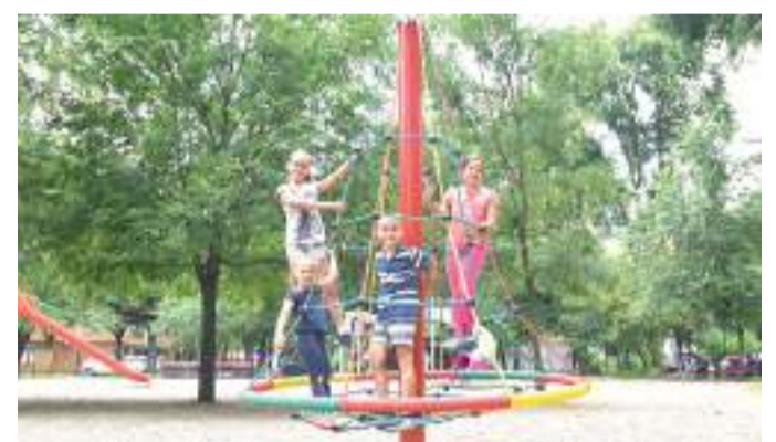
Nagyon szeretik a gyerekek a Retek utcai játszóteret.

Decemberben meghosszabbította a közgyűlés az önkormányzat és a Magyar Máltai Szeretetszolgálat megállapodását, így továbbra is a máltaiak üzemeltethetik a Retek utca 2. szám alatti játszóteret. A város idén megemelt összeggel, 7,8 millió forinttal támogatja a játszóteret üzemeltetését, és 600 ezer forintot ad a fejlesztésére.