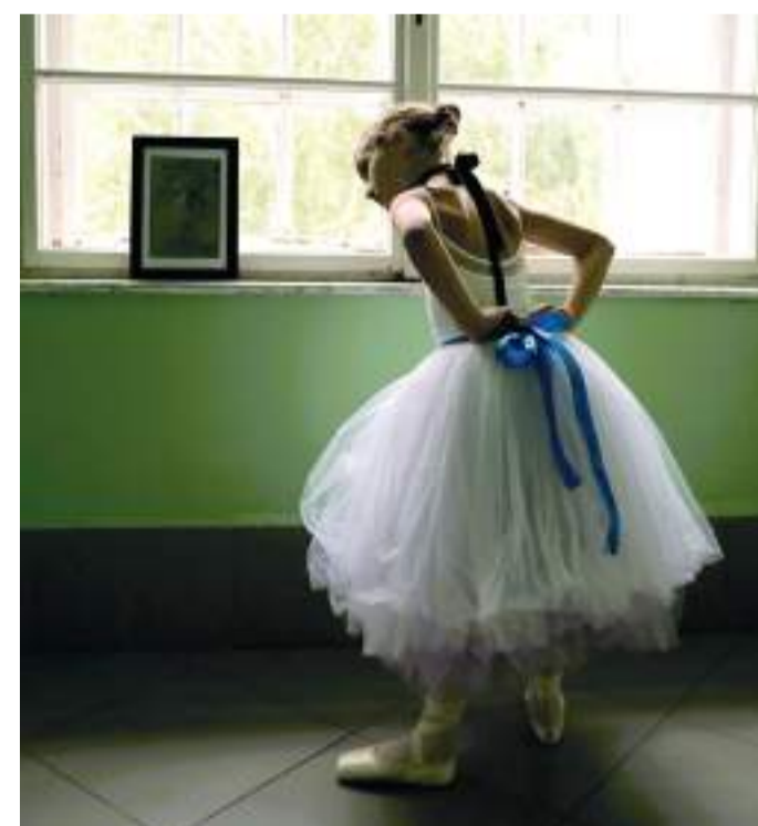
Életre kelteni egy festményt. Kincső.