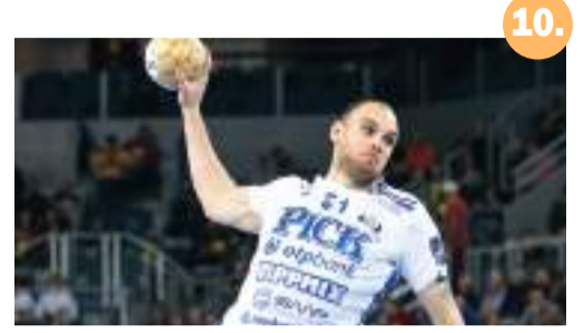
10. Pick: egy maradó, egy távozó