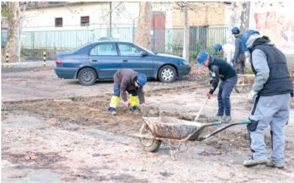
A Csongor téren az egykori Szetáv-épület elbontásával és a terület rendezésével kezdődött el a munka januárban.

Idén is folytatódik az önkormányzat parkolóépítési programja