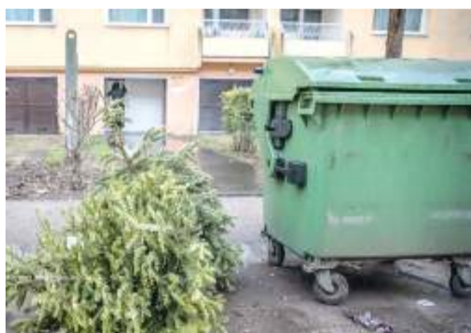
Díjmentesen viszik el a kidobott fenyőfákat.

• A másfél méternél nagyobb fenyőfákat a társaság szakemberei csak úgy tudják elszállítani, ha azt a tulajdonosa előzőleg kettévágja, mivel a jármű garatrészébe nem helyezhető másfél méternél nagyobb hulladék.