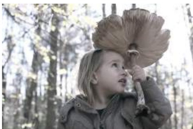
Nagy őzláb. Boróka.