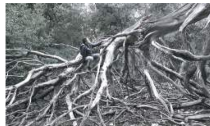
Fára mászni. Álmos.