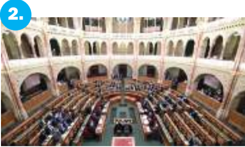
2. Szeged parlamenti képviselői számokban