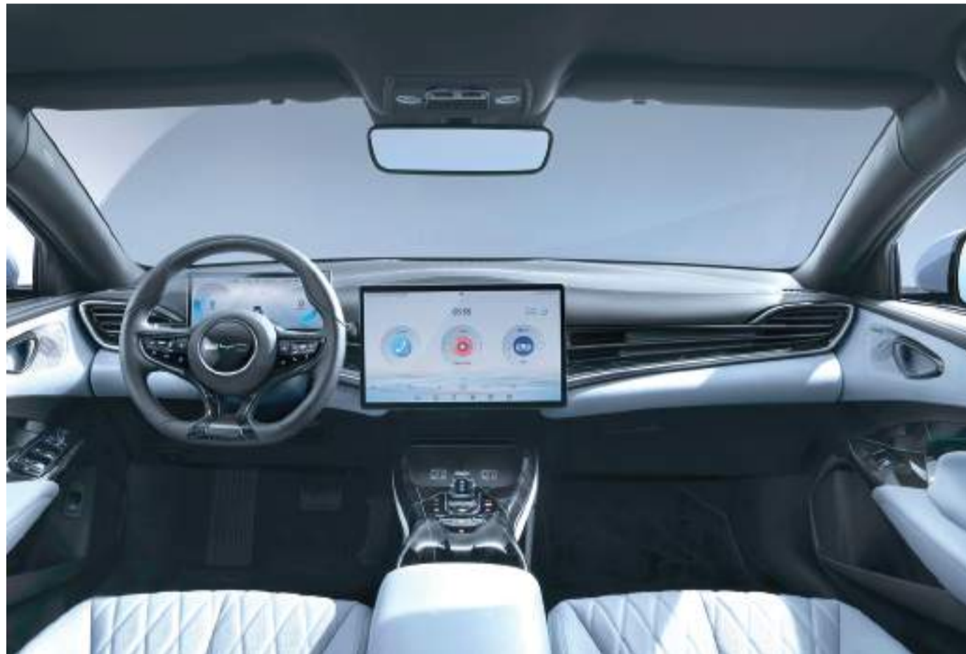
Jó kilátások. Egy BYD Seal utastere. Ilyen autó is készül majd Szegeden.

A kínai óriáscég Szegeden keresztül hódítaná meg Európát