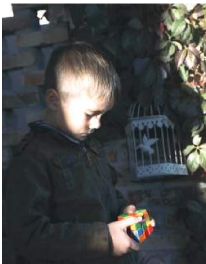
Rubik kocka. Kende.