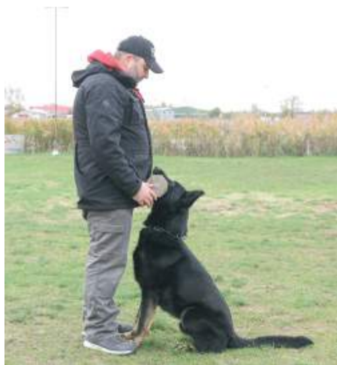
A jövő bajnoka. Így figyel oktatójára Oki, a német juhász.