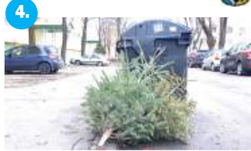
4. Február 2-áig ingyen viszik el a fenyőt