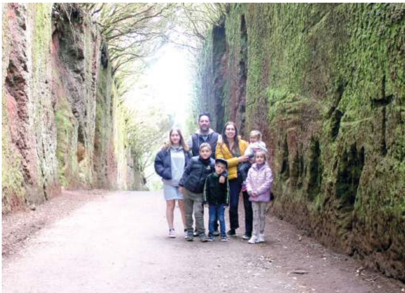
A család, automata beállítással.