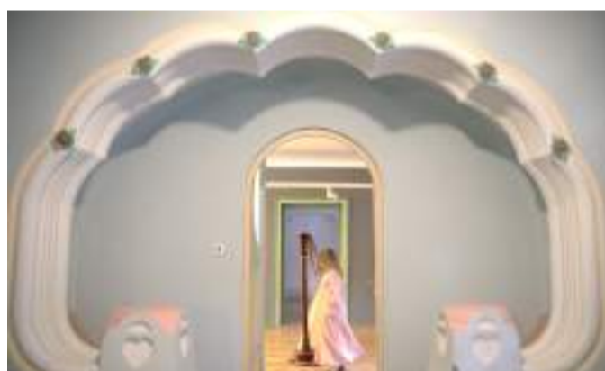
A hárfás lány. Villő.