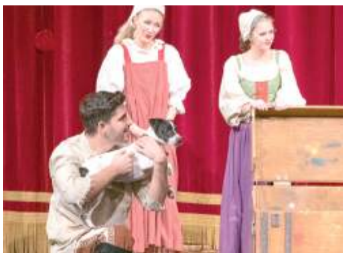
A Szerelmes Shakespeare kutyasztrája a szegedi színház színpadán.