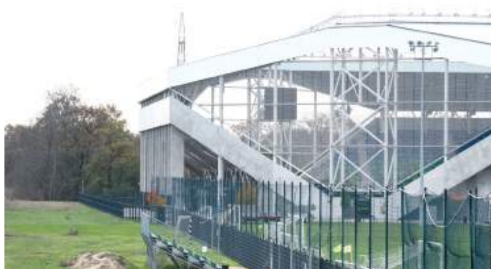
Előtérben a püspöki stadion, háttérben a véderdő.

Rendelettel akadályozta meg az Orbán-kormány, hogy Szeged város közgyűlése megvédhesse a kivágástól azt a hat hektáros véderdőt, amelynek helyére iskolát építene a Szeged-csanádi egyházmegye. Az önkormányzatnak van alternatív javaslata az iskola helyszínére, mely száz méterre fekszik a véderdőtől, közel a püspöki stadionhoz, ahol fakivágás nélkül lehetne megépíteni az intézményt – mindhiába, a püspökség egyelőre köti az ebet a karóhoz.