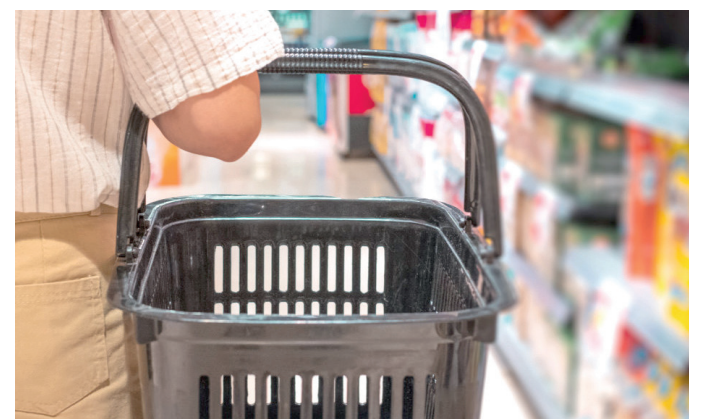
Mivel lesz tele a kosár? Brutálisan megdrágultak az élelmiszerek.

A szakértők szerint nyáron 800 vagy akár 1000 forintba is kerülhet egy kiló kenyér.