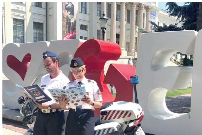
A megyei rendőr-főkapitányság munkatársai.