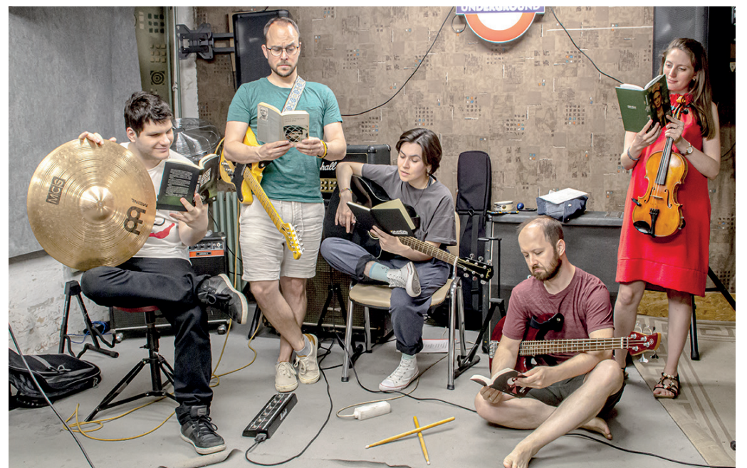
A könyvek és a hangszerek megférnek egymás mellett: a KidsAlone zenekar.

A Szegeden divat az olvasás sorozat kapcsán a városhoz kötődő, sokaknak példaképként szolgáló személyiségek osztják meg hétről hétre kedvenc olvasmányélményeiket és ajánlanak olvasnivalót a Szegedi Tükör hasábjain. Az idei könyvhét kapcsán a Somogyi-könyvtár játékra hívta az érdeklődőket. A Szegeden divat az olvasás sorozatban szereplő közismert olvasók mintájára a feladat csupán annyi volt, hogy a jelentkezők készítsenek magukról egy fényképet olvasás közben a város egy ikonikus pontján, és töltsék fel a közösségi oldalakra. Ezekből a felvételekből válogattunk.