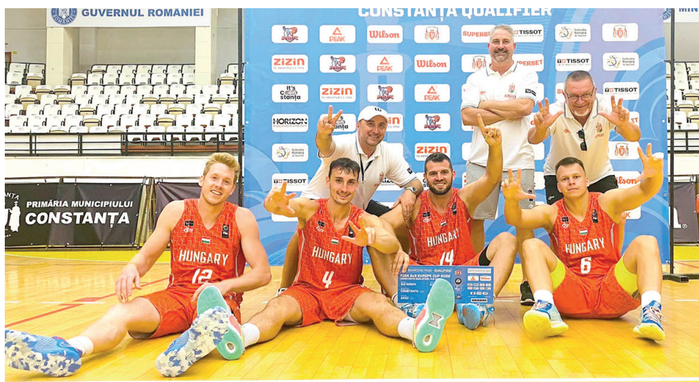
A magyarok öröme: Eb-re készülhet Keller (12), Demeter (4), Ivosev (14) és Kelemen (6).

9. és 11. között Grazban sorra kerülő Eb-n. Ez azért történt, mert bár a tornáról papíron csak a két finalista biztosította helyét a kontinens-tornán, az oroszok kizárása nyomán megüresedett helyet fel kellett tölteni. Ehhez a konstancai és az ezzel párhuzamosan zajló izraeli selejtezőtorna kijutásról lemaradt csapatait rangsorolták, ebben pedig a 4/1-es győzelmi mutatóval zárt magyaroké volt a legjobb mérleg.