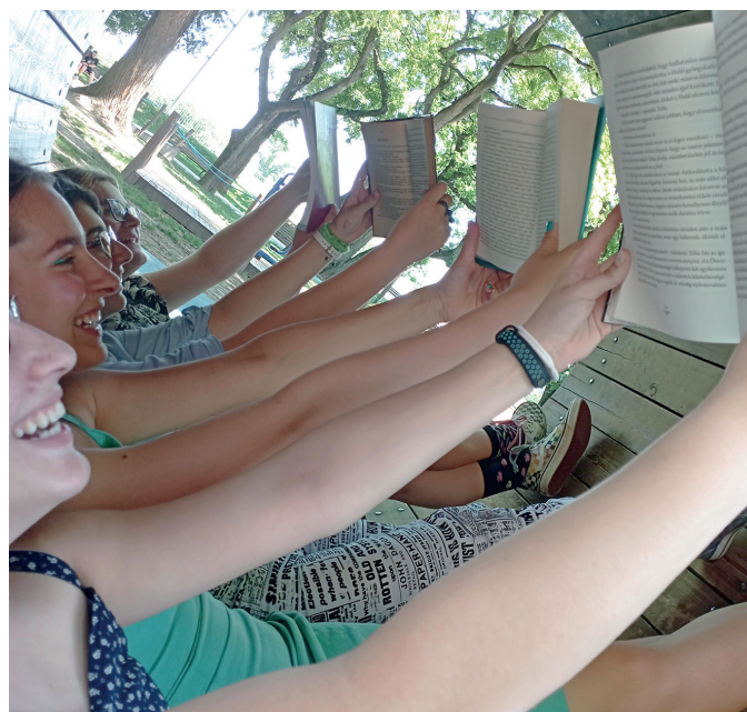
A Radnóti Miklós Gimnázium diákjainak fotója I.