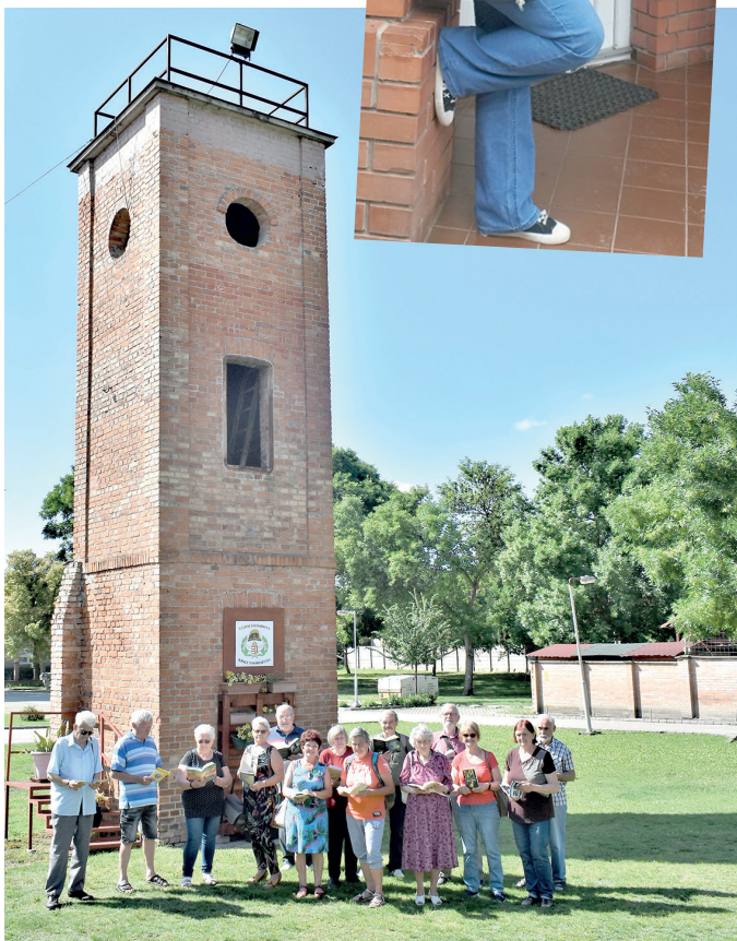
A Nap-Fény Fotókör a dorozsmai tűzoltótoronynál.

A Szegeden divat az olvasás sorozat kapcsán a városhoz kötődő, sokaknak példaképként szolgáló személyiségek osztják meg hétről hétre kedvenc olvasmányélményeiket és ajánlanak olvasnivalót a Szegedi Tükör hasábjain. Az idei könyvhét kapcsán a Somogyi-könyvtár játékra hívta az érdeklődőket. A Szegeden divat az olvasás sorozatban szereplő közismert olvasók mintájára a feladat csupán annyi volt, hogy a jelentkezők készítsenek magukról egy fényképet olvasás közben a város egy ikonikus pontján, és töltsék fel a közösségi oldalakra. Ezekből a felvételekből válogattunk.