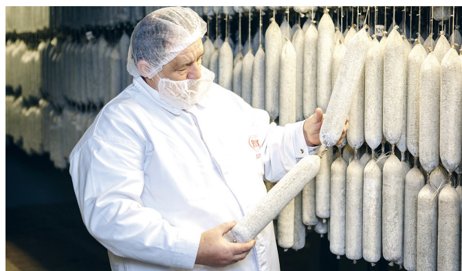
Főként az Európai Unióba exportál a Pick.

A vállalkozás a beszámolója szerint 1934 munkavállalót foglalkoztatott a tavalyi évben. A beszámolóban emlékeztetnek arra, hogy a Pick Szeged Zrt. is részt vett