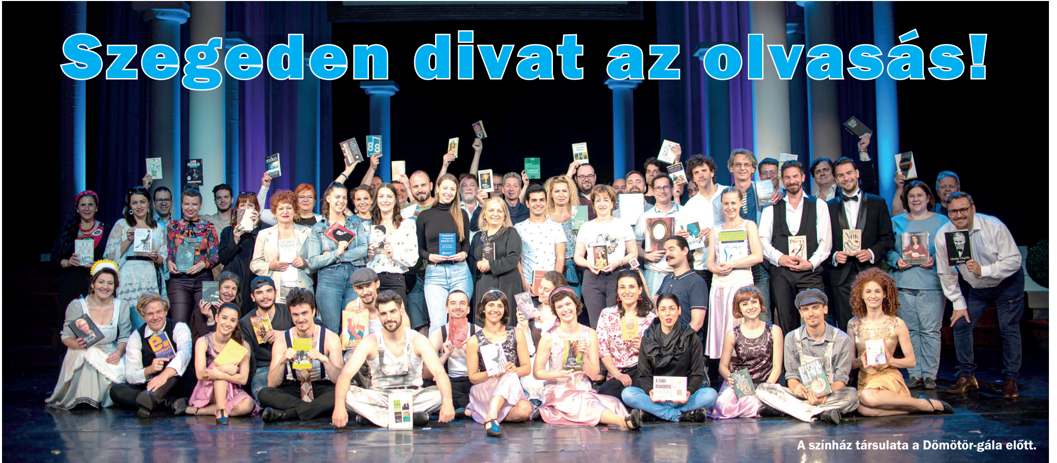
A színház társulata a Dömötör-gála előtt.