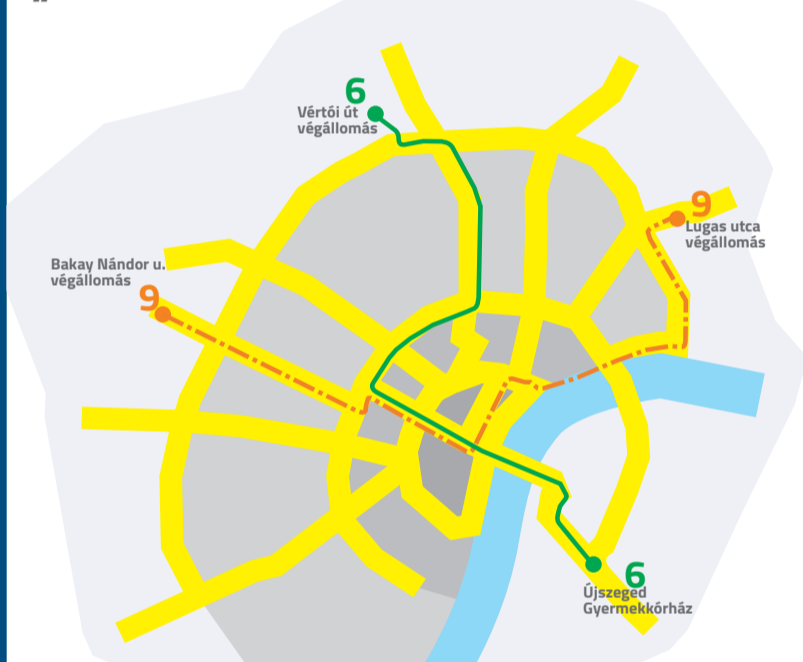
„ÚJ” TROLIBUSZ VONALHÁLÓZATI TÉRKÉP