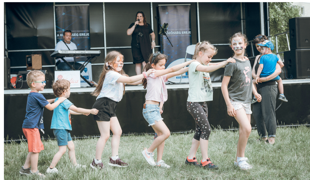
Megtelt családokkal a Lomnici utcai Honfoglalás park.

Teljesen megtelt családokkal a Lomnici utcai Honfoglalás park a múlt szombaton, ahová pünkösdi gyermeknapra hívták a városrész lakóit. A közösségi rendezvény egy uniós program segítségével jött létre, mely a helyi összetartozás erősítését célozza.