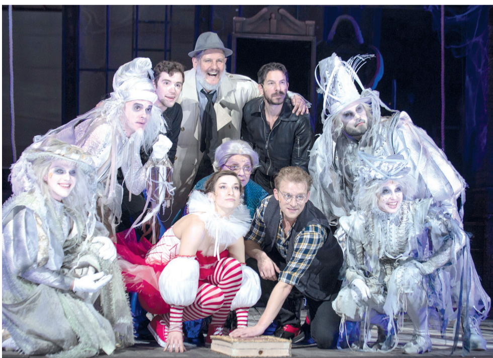
A Padlás szereplői. Töretlen a musical sikere: 43 estén összesen 24 ezren látták.

A 2021–2022-es évadban csaknem 100 ezren látták a szegedi színház előadásait