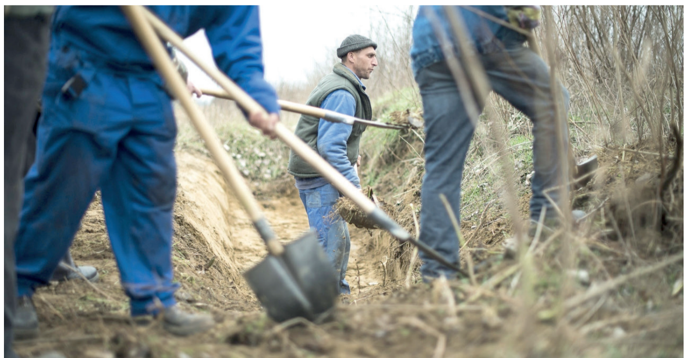
A KSH nem számol a közfoglalkoztatottakkal és az öt főnél kevesebb munkavállalót foglalkoztató cégekkel. Ezért is mutat ki magasabb átlagbért. Képünk illusztráció.

A szeged.hu rendszeresen közzéteszi a medián-, azaz középbért, ami jelenleg nagyjából nettó 250 ezer forint körül van Magyarországon. A mediánbér-számítás lényege, hogy nem átlagot számolnak, hanem az összes keresőt sorba állítva a középsőnek nézik meg a bérét. Ez jobban tükrözi a társadalmi valóságot, mint az átlag, amelyet egy szűk réteg milliós fizetése húz föl. Utóbbit bizonyítja a GKI mostani számítása is, hiszen tíz magyar településből kilencben nem keresik meg az átlagbért. Budapesten nyilván igen, sőt a főváros jócskán felfelé viszi az átlagot.