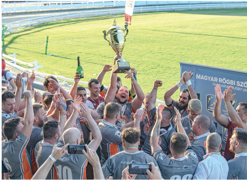
Történelmet írtak a bajnoki címet szerző szegedi rögbisek.