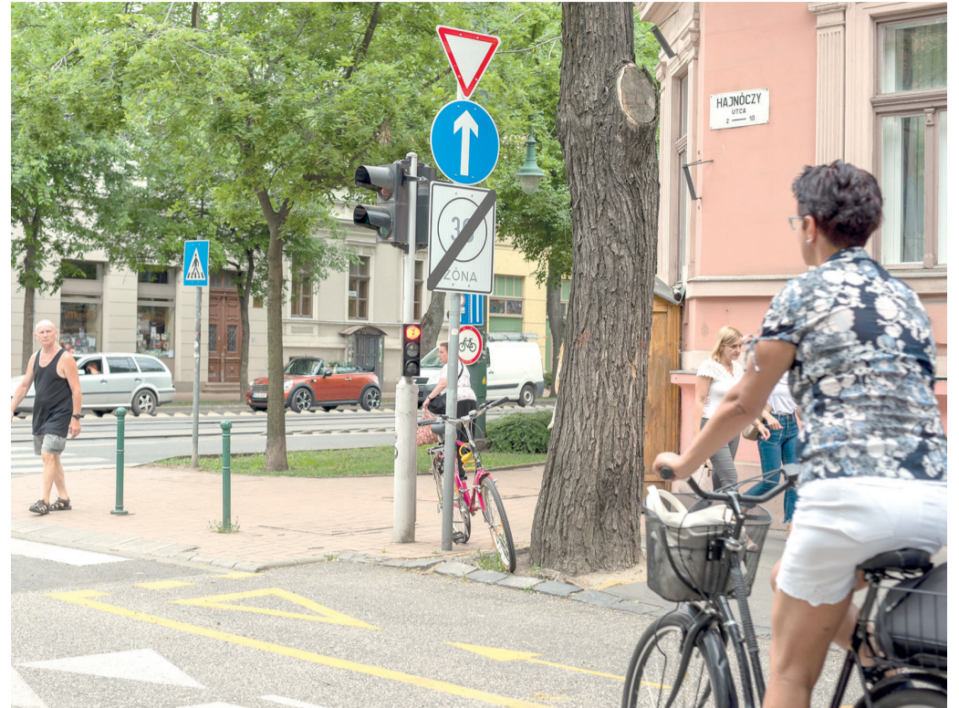
A Hajnóczy utcában is szabályosan közlekedik kerékpáros a nagykörút felől a Tisza Lajos körút irányába.

Húsz belvárosi egyirányú utcát nyitottak meg az ellenkező irányból a kerékpárosok számára; ezt táblák kihelyezésével és kerékpáros nyom felfestésével jelölték. Az érintett közterületek: Ady tér,