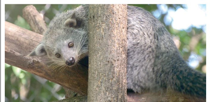
Binturongbújóska a Szegedi Vadasparkban.

CS ak két hazai állatkertben láthatók binturongok. A Szegedi Vadaspark binturongpárjának kölykeivel már a kifutóban is találkozhatnak a látogatók. A binturong az egyik legnagyobb termetű és talán a leglátványosabb cibetmacskaféle. Nemcsak külsejük miatt különlegesek, hiszen első látásra nehéz eldönteni, hogy macskáról, medvérről vagy esetleg menyétféléről van-e szó, hanem azért is, mert ez az egyetlen olyan emlős a majmokon kívül, amelyik képes kapaszkodásra is használni a farkát. Az állat jellegzetessége még az egyedi szaga, mely sokakat a pattogatott kukorica illatára emlékeztet. A faj képviselői 2012 óta laknak a Szegedi Vadasparkban, ahová egy európai fajmentő tenyésztőprogramban érkeztek. Tao és Shien jó szülőknél bizonyultak, több alkalommal neveltek már utódokat, amelyek később más – francia, szerb, holland, olasz és lengyel – állatkertekbe kerültek. A csapat legifjabb lakói szintén költözni fognak, ha felnőnek, de idén még biztosan láthatók Szegeden.