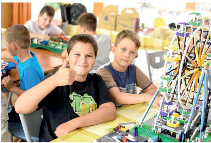
Nagyon népszerű a robotika tábor.

A hagyományos táborok (színhátszó, kalóz, indián és bűvész) mellett újdonság a KRESZ- és a retorika tábor. A programfüzetben 150 különféle táborozási lehetőséget kínálnak a város intézményei. A Szent-Győr-