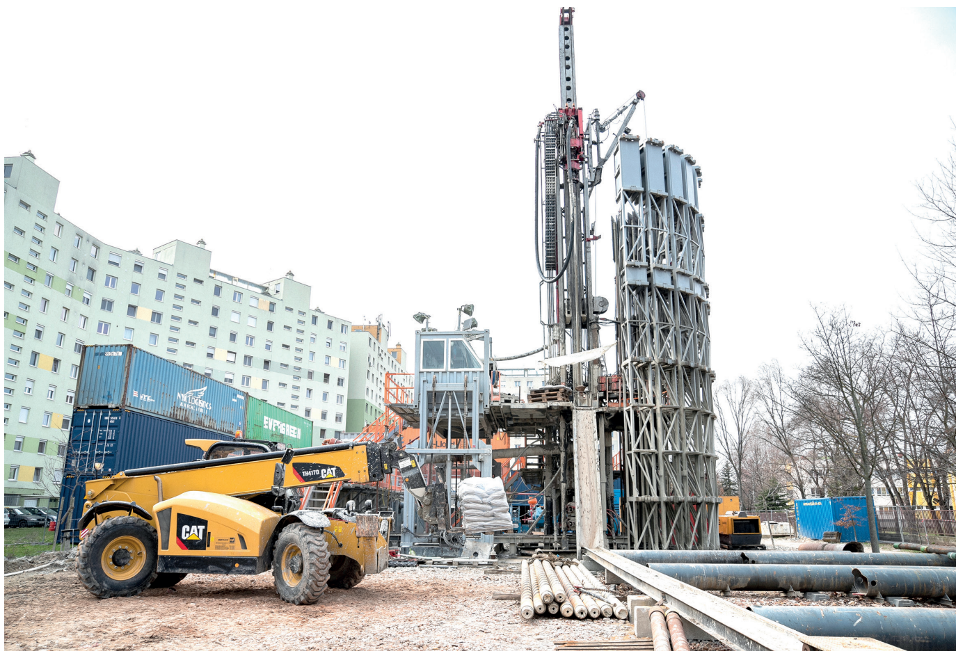
2018 óta zajlik a szegedi geotermikus rendszer kiépítése. Négy rendszer már elkészült a kilencből, öt újabb városrészben márciusban kezdtek hozzá a munkához.

Szeged már két évtizede azt teszi, amit az Orbán-kormány elmulasztott megtenni