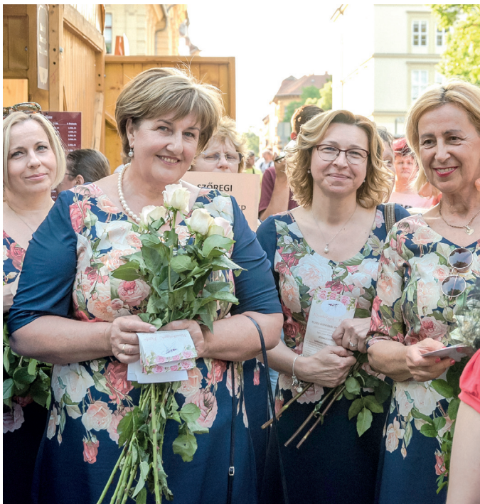
Szőregi rózsahölgyek.

A Széchenyi téri borfesztiválon mindennap óriási a tömeg és leírhatatlan a hangulat. Érdemes azonban tenni egy sétát a Klauzál és Dugonics tér útvonalon, ahol kézműves söröket, háztáji termékeket és sok programot kínálnak. Lapzártánk után kezdődött a koncertsorozat a Dóm téren, és az ünnepsorozat zárásaként rendezik meg a hídi vásárt.