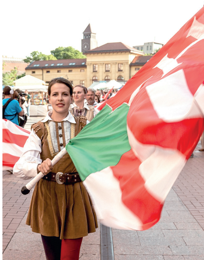
A Pavane Táncegyüttes a borrendek vonulásán.