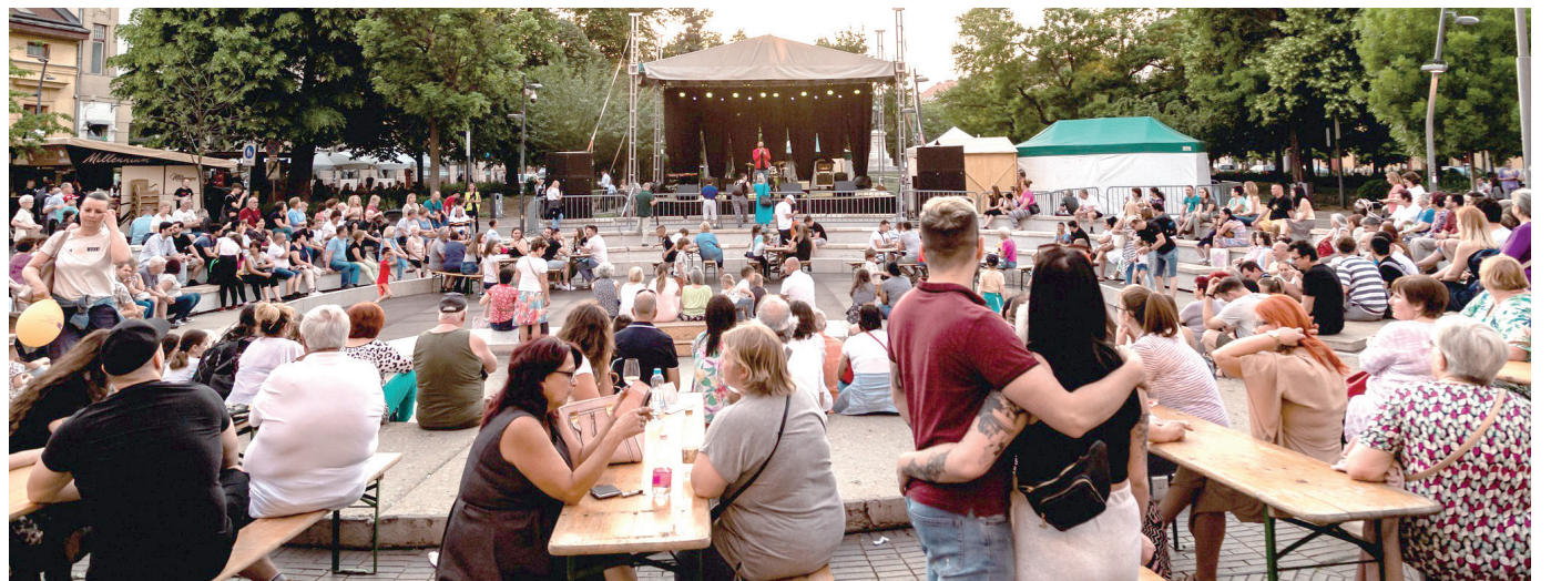
Koncert a Dugonics téren.