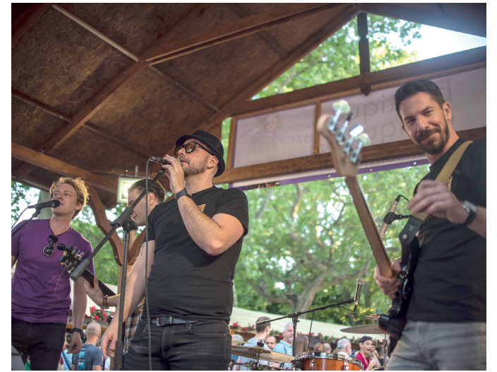
A Teát Rummalkonzerten egy gombostűt sem lehetett leejteni a Széchenyi téren.