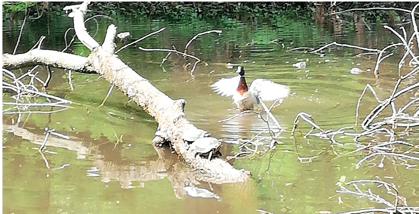
Aki figyelmesen megnézi a képet, három állatot is felfedezhet.