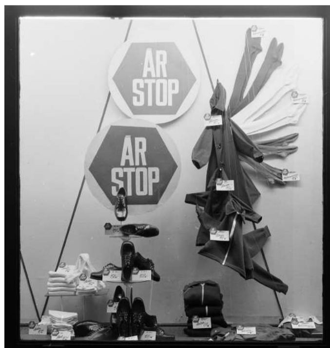
Árstop 1973-ban.