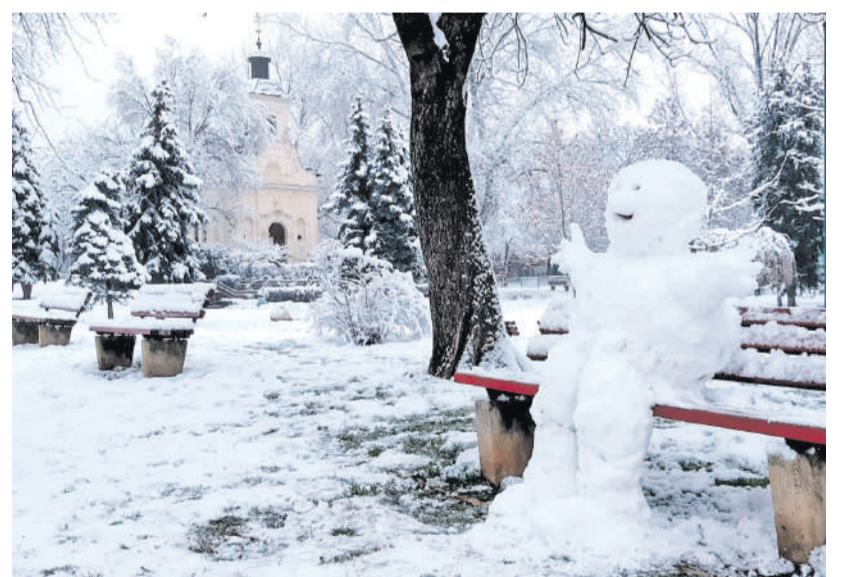
Hóember a Lechner téren.