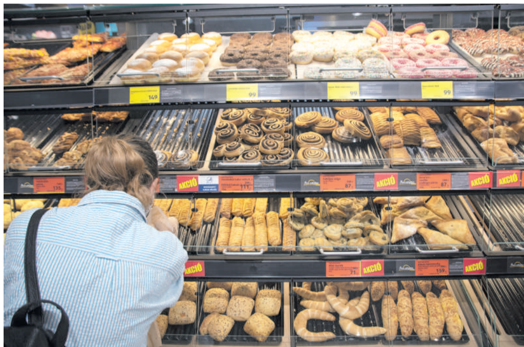
A finomliszt kilójának ára átlagosan 21 százalékkal emelkedett az elmúlt hónapokban. Illusztráció: Szabó Luca

Drasztikusan elszálltak az élelmiszerárak, másfél évtized után újból megtapasztaltuk, mit jelent a magas infláció. A fogyasztói árak növekedési üteme 7,4 százalékon tetőzött tavaly novemberben. Bár túljutottunk az inflációs csúcson, egyelőre semmi okunk az öröme. A jegybank legfrissebb előrejelzése szerint idén az éves átlagos infláció 4,7–5,1 százalékos lesz, de az élelmiszerárak közel 7 százalékos további növekedésével számolhatunk.