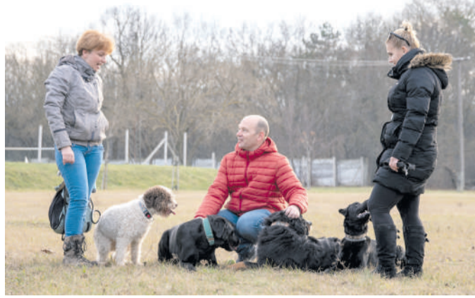
Avramov András képviselő (piros kabátban) szőregi kutyásokkal a Pálya téri futtatón.

Régi lakossági igényt elégített ki az önkormányzat. A hatályos törvények szerint csak pórázon lehet kutyát