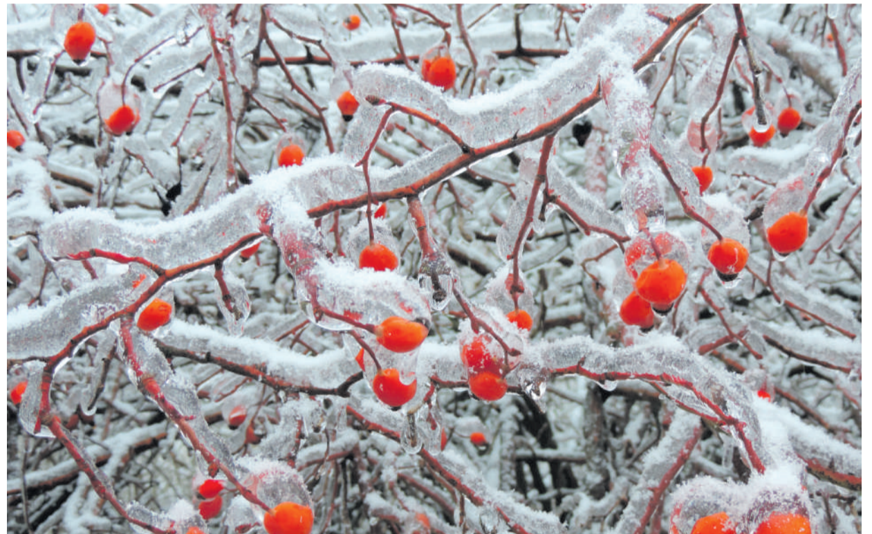
Havas és jeges.