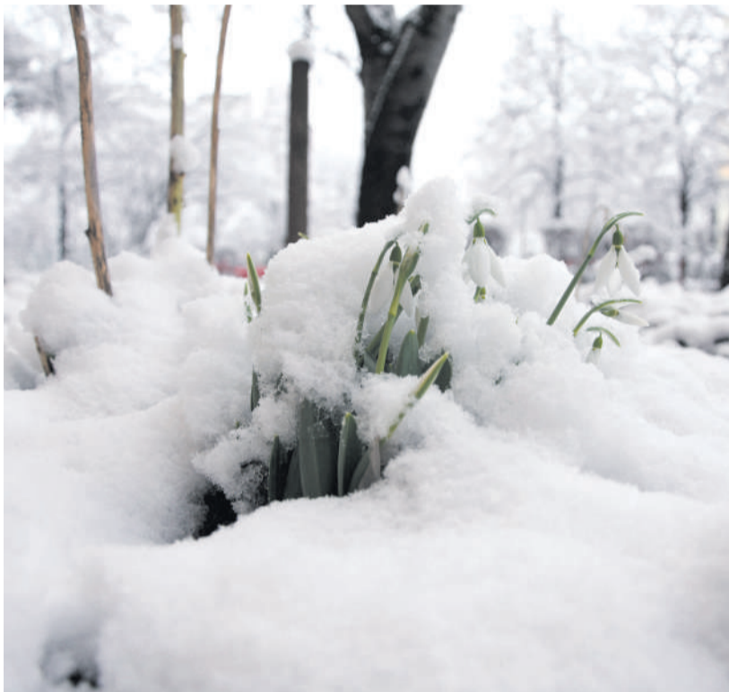
Hó és virág.