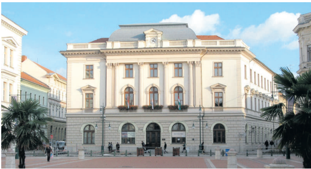
Másfél milliárd forintért adta el az állam Szeged egyik legismertebb épületét.

A Klauzál tér 9. szám alatti műemléki védettségű épület tulajdonosa az NKM Zrt. volt, irodákat alakítottak ki benne, de a Démász, majd az NKM Áramszolgáltató Galéria is itt működött, ahol több szegedi művészenek volt kiállítása az elmúlt években.