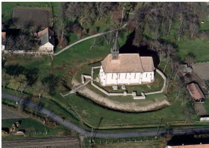
Óföldsék, Római katolikus erődtemplom

Az óföldséki erődtemplom megtekintése, a májusban átadott Makovecz Imre által tervezett József Attila Városi Könyvtár bejárása, József Attila emlékek Makón, Vacsora Kübekházán.