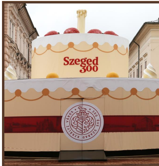
Szeged „Tortája” Interaktív élménytér